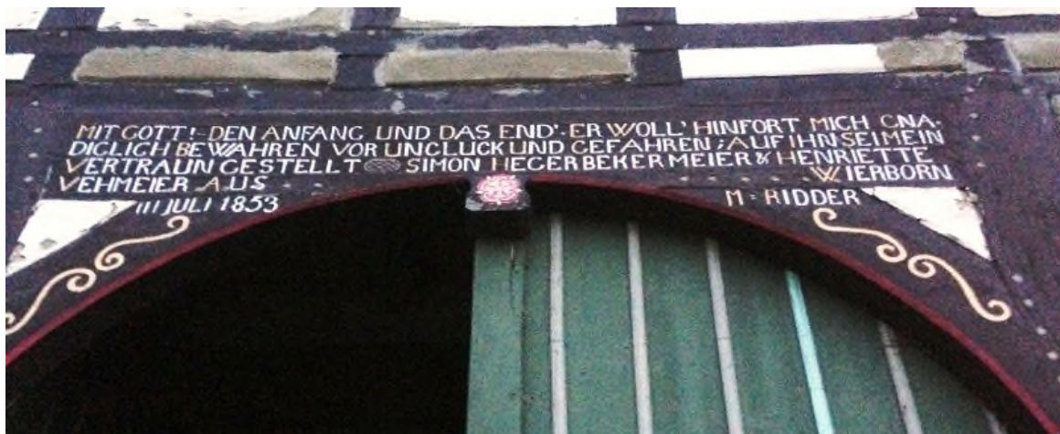
Foto: Torbogen des Hofes „Hegerbeke“ in Kalletal-Dalbke